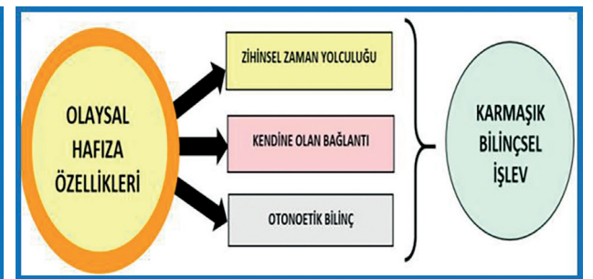
Şekil 2. Olaysal Hafızanın Özellikleri

KH süreci, daha esnek ve değişen iş çevrelerine cevap verebilen ve rekabet avantajı açısından sürdürülebilirliğe sahip kuruluşlara sahip olmak açısından kurumsal yetenekleri geliştiren ve bilgi üreten bir süreçtir. Bilgi edinimi, kuruluşun mevcut bilgi stokunu artıran yeni fikirlerin, bilgi ve becerilerin oluşumu ve gelişimi sürecini veya faaliyetini ifade eder. Bilgi edinimi, çalışanların katılımı ile kaynakların ve teknolojinin etkileşiminin bir sonucudur. Bilginin yayılması, öğrenme sürecinin kalitesini etkiler. Bilginin etkin bir şekilde yayılması, kurumlarda daha geniş çaplı öğrenmeye ve kaynaklardan yararlanma fırsatının artmasına neden olur. KH, bilginin depolanması ve yeniden değerlendirilmesine yönelik bir yapı olup, bireysel ve kurumsal düzeyde bir oluşumdur. Depolanan bilgi, gelecekteki algılama ve